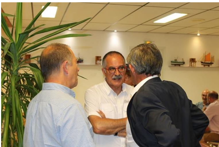
50 ans du Comité 17 Le 16 juin 2018 A Ronce Les Bains