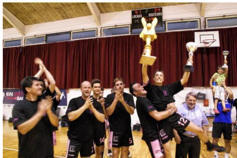
Oléron vainqueur Coupe 17 Seniors Le 3 juin 2011 Au Bois en Ré