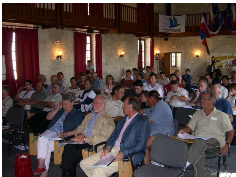
AG du CD 17 Le 11 juin 2005 A Pons