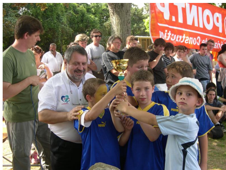
Journée des Jeunes Le 10 juin 2007 A Courçon