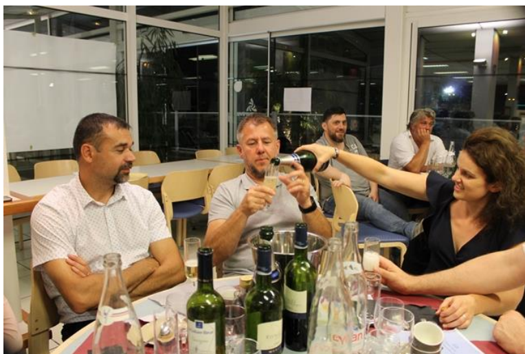
50 ans du Comité 17 Le 16 juin 2018 A Ronce Les Bains