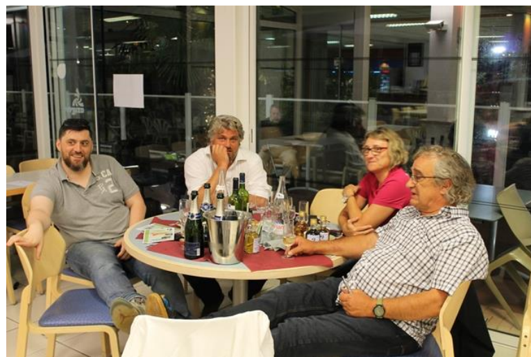
50 ans du Comité 17 Le 16 juin 2018 A Ronce Les Bains