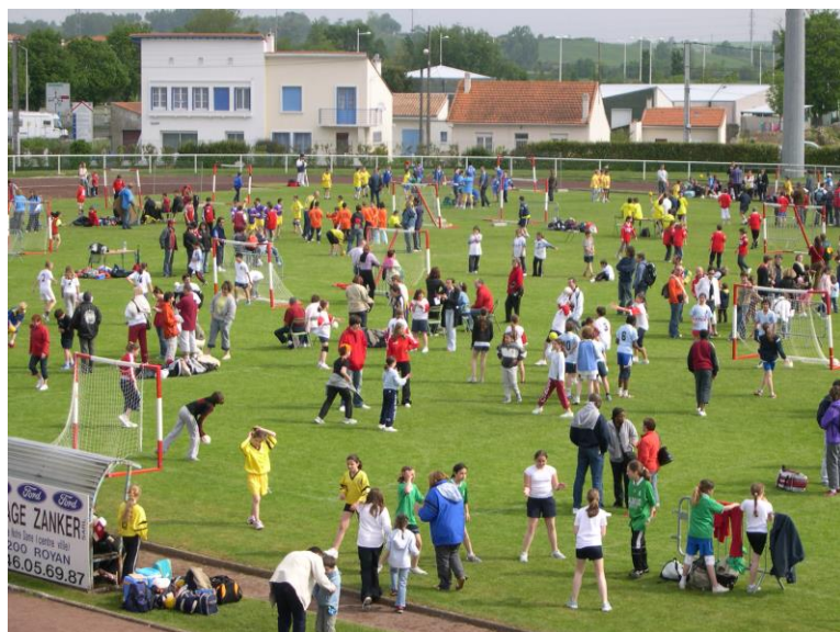
Journée régionale des Jeunes Le 7 mai 2006 A Royan