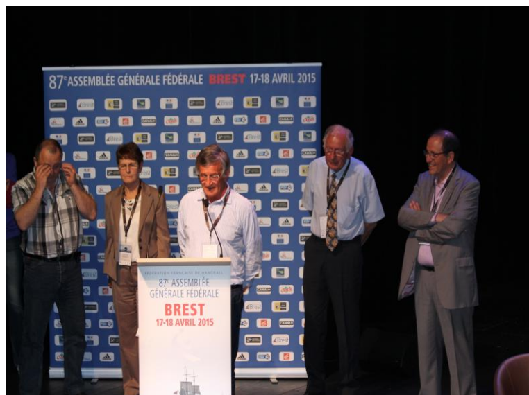
AG FFHB Le 17 avril 2015 A Brest