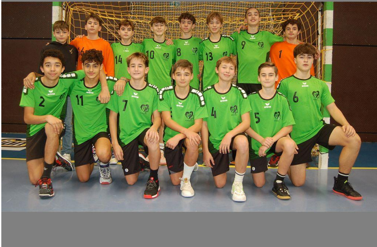
LA SELECTION MASCULINE AUX INTER – COMITES LE 4 NOVEMBRE A COGNAC