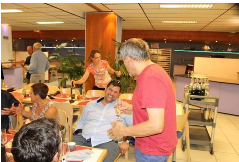
50 ans du Comité 17 Le 16 juin 2018 A Ronce Les Bains