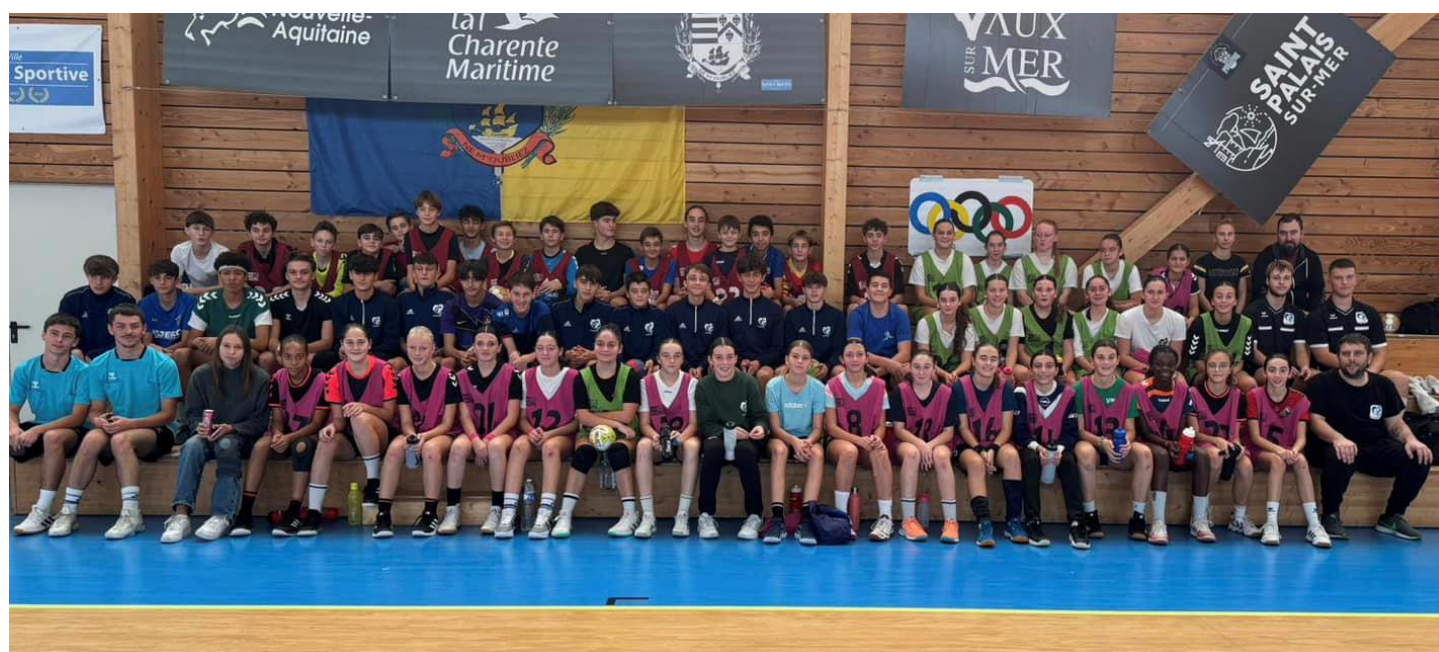
Nos Sélections en stage à Royan du 1 er au 3 Novembre