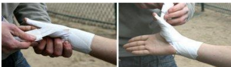
Etapes 3 et 4.

2. Posez une attelle avec une bande adhésive non élastique sur la face antérieure de la colonne du pouce. Auparavant, découpez un petit triangle en haut de cette bande pour faire passer le pouce.