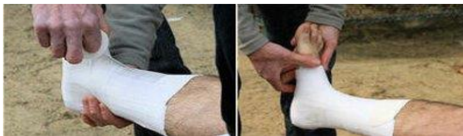
Étapes 7 et 8.

7. Le strapping doit être complètement "fermé", c'est-à-dire que l'intégralité de la zone doit être bandée.