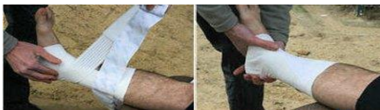
Etapes 5 et 6.

4. Placez une embase au milieu du mollet puis une attelle active verticale (ou deux décalée de 1 centimètre vers l'avant).