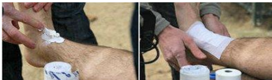
Étapes 1 et 2.

Ici, la durée d'immobilisation ne doit être que de quelques heures, le temps de l'activité physique.