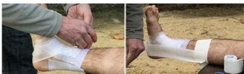
Étapes 3 et 4.

2. Placez sur cette crème une compresse.