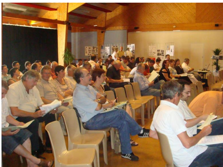
AG du CD 17 Le 14 juin 2008 A Ronce Les Bains