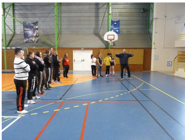
Formation des Animateurs Le 12 mars 2017 A Rochefort