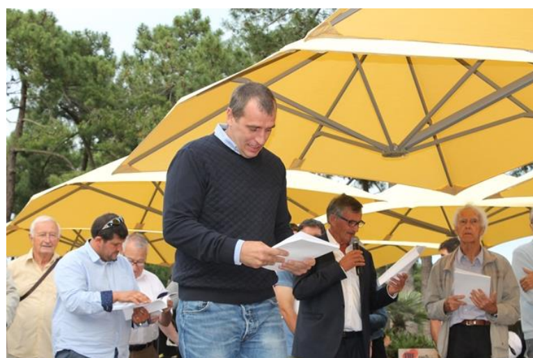
50 ans du Comité 17 Le 16 juin 2018 A Ronce Les Bains