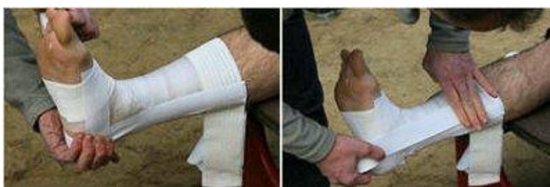
Etapes 5 et 6.

4. Place maintenant aux "attelles actives". Partez de l'embase supérieure et faites passer la bande sous le pied, puis remontez jusqu'à l'embase de l'autre côté de la jambe.