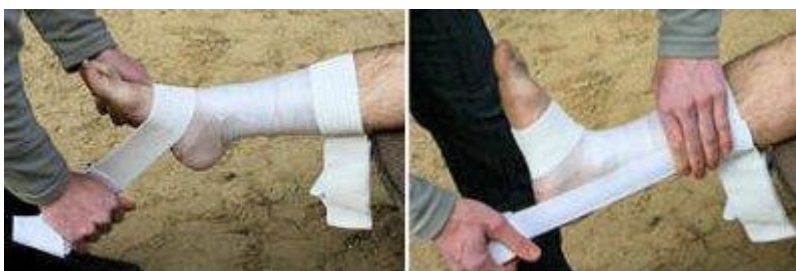
Etapes 3 et 4

Lorsque votre pied "tourne", la première chose est de stopper immédiatement votre activité physique. Utilisez ensuite une vessie en caoutchouc avec de la glace pour diminuer l'enflure de la cheville et la douleur. Enfin, il va falloir strapper votre cheville. Cette contention "thérapeutique" a pour objectif d'immobiliser et de protéger la cheville. La durée d'immobilisation sera de 5 à 8 jours pour une entorse bénigne et de 12 à 15 jours pour une entorse moyenne.