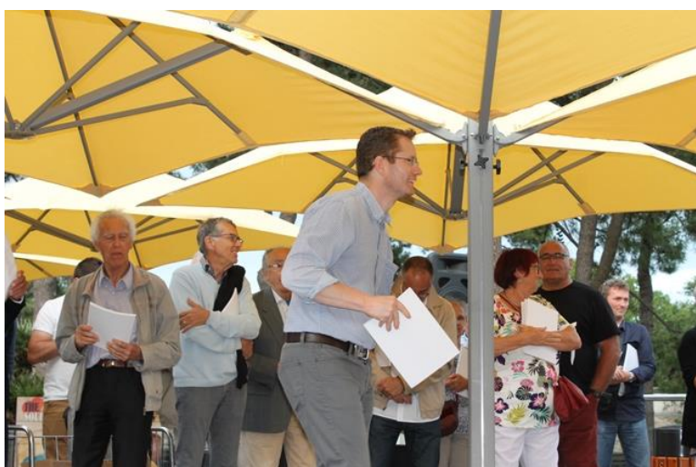
50 ans du Comité 17 Le 16 juin 2018 A Ronce Les Bains