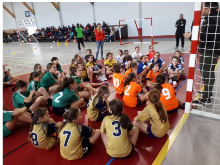
Hand à quatre Le 9 novembre 2019 A Pons