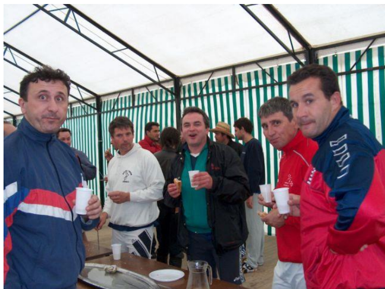
Tournoi Passion Le 19 mars 2006 A Surgères