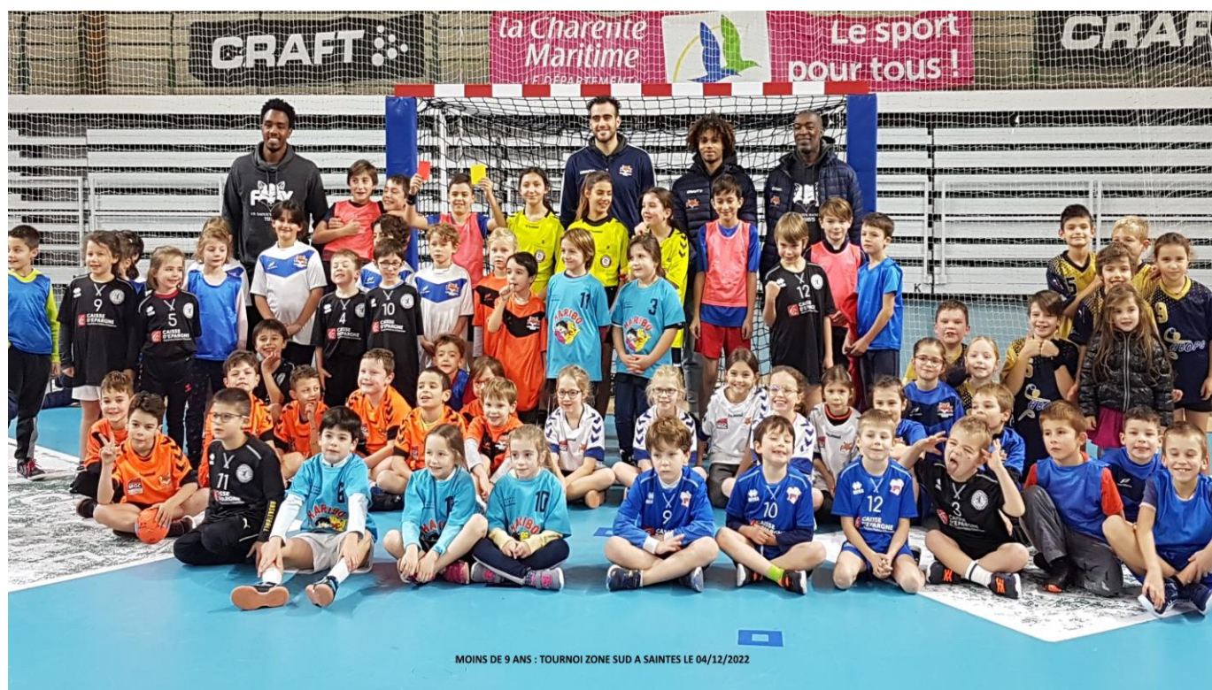
MOINS DE 9 ANS : TOURNOI ZONE SUD A SAINTES LE 04/12/2022