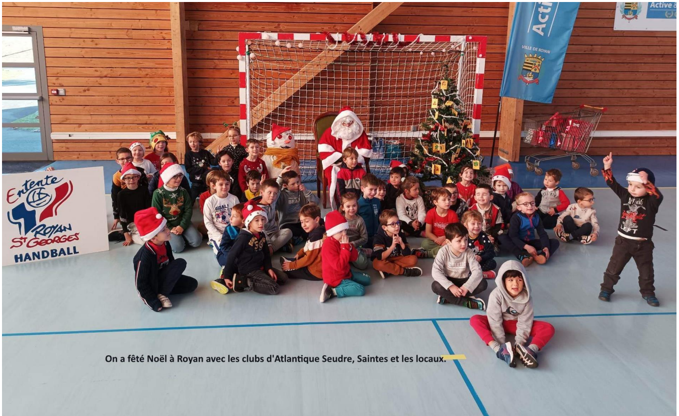
On a fêté Noël à Royan avec les clubs d'Atlantique Seudre, Saintes et les locaux.