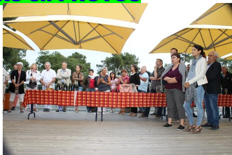
50 ans du Comité 17 Le 16 juin 2018 A Ronce Les Bains