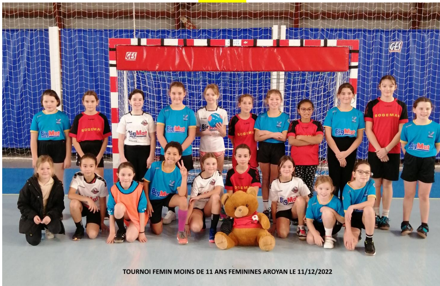
TOURNOI FEMIN MOINS DE 11 ANS FEMININES AROYAN LE 11/12/2022