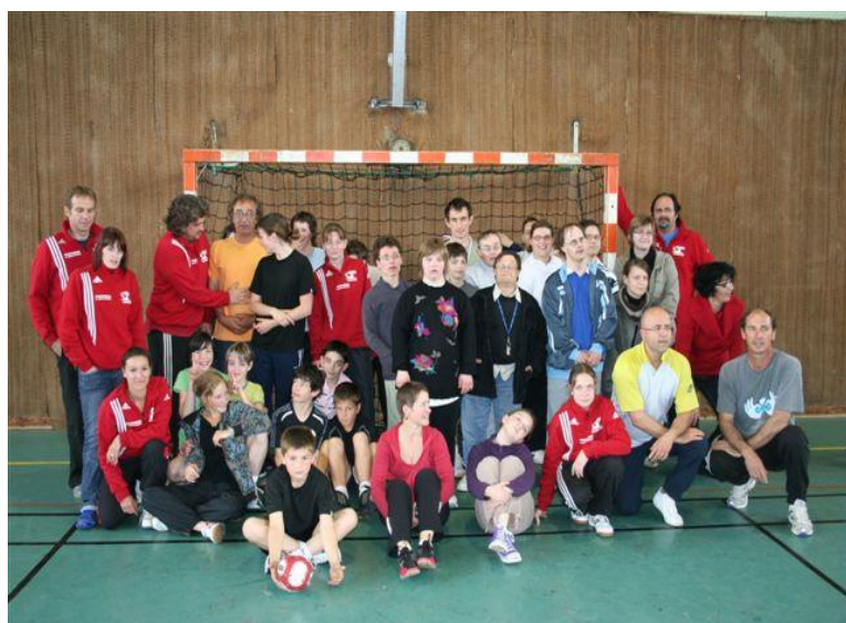
Journée Handicap Le 17 mai 2009 A St. Hilaire