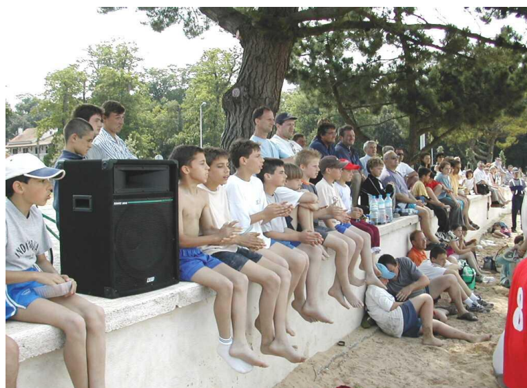
Sandball des Jeunes Le 2 juin 2002 A Fouras