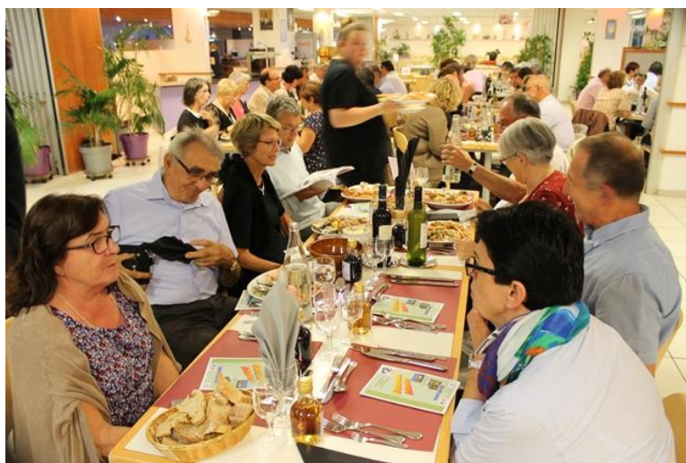
50 ans du Comité 17 Le 16 juin 2018 A Ronce Les Bains