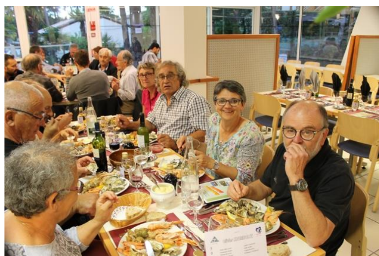
50 ans du Comité 17 Le 16 juin 2018 A Ronce Les Bains