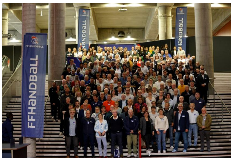
SOUVENIR D'UN STAGE « DIETETIQUE »