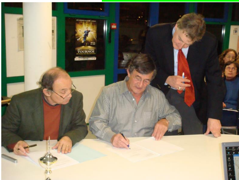
Signature Mécénat avec le CMO Le 30 janvier 2009 A Saintes