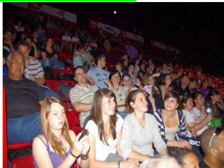
Coupe de France Le 21 mai 2011 A Bercy