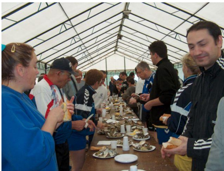
Tournoi Hand Passion Le 19 mars 2006 A Surgères