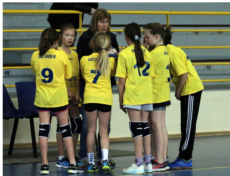
Rassemblement Moins de 11 Féminin Le 13 mars 2016 A Rochefort