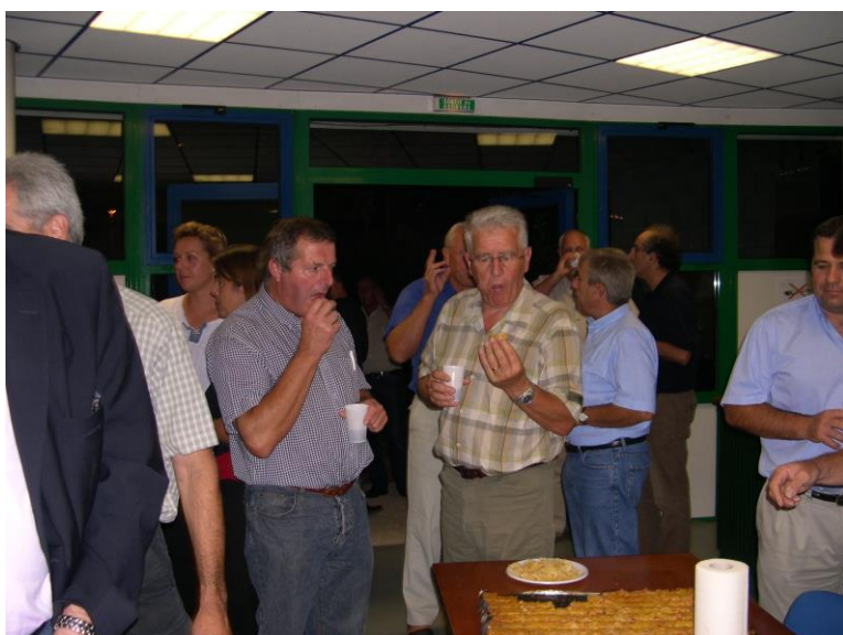
AG du CD17 Le 17 septembre 2004 A Saintes