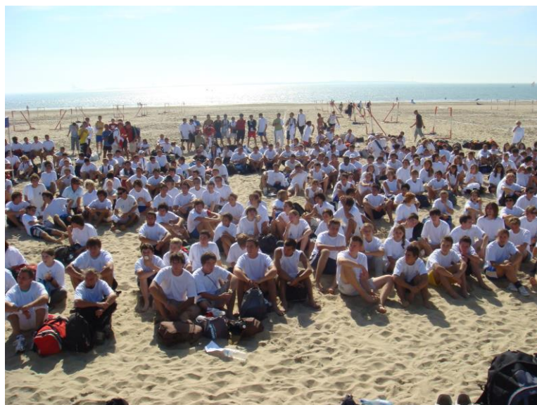
Sandball des Lycées Le 30 septembre 2009 A St. Georges de Didonne