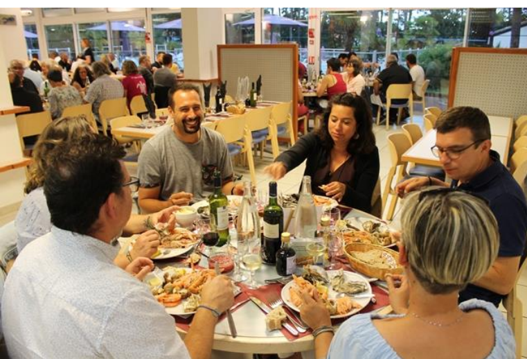
50 ans du Comité 17 Le 16 juin 2018 A Ronce Les Bains