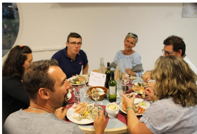
50 ans du Comité 17 Le 16 juin 2018 A Ronce Les Bains