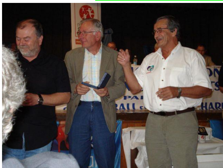
AG Ligue Le 23 juin 2007 A Oléron