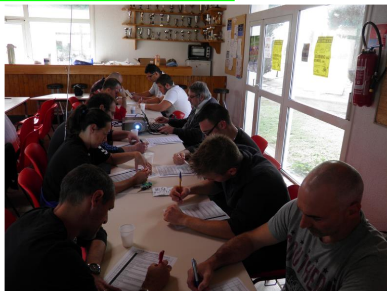
Stage Arbitrage Le 15 septembre 2013 A Rochefort