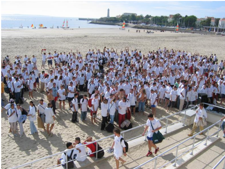
Sandball des Lycées Le 29 septembre 2004 A St. Georges de Didonne