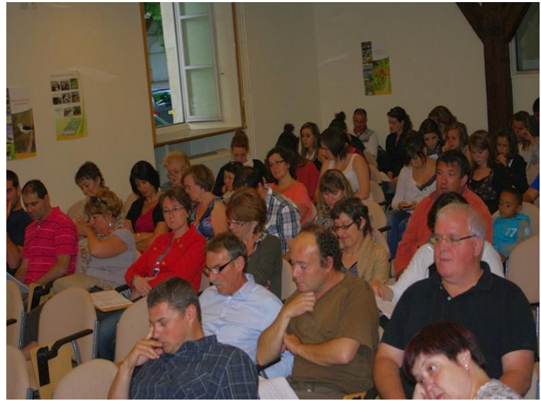
AG du club Le 15 juin 2012 A Rochefort