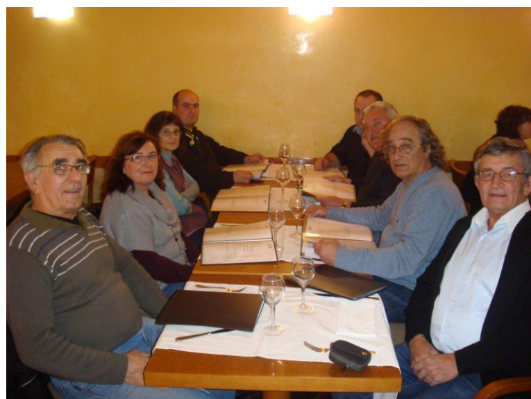
Championnats du Monde Le 11 janvier 2013 A Barcelone