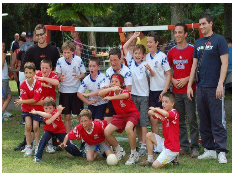
Journée des Jeunes Le 10 juin 2007 A Courçon