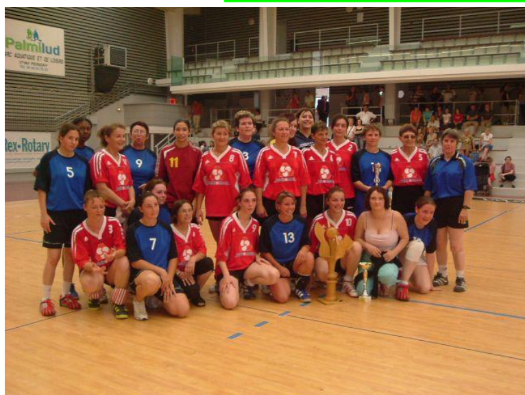
Coupe 17 féminines (Aulnay-Royan St.G) Le 10 juin 2007