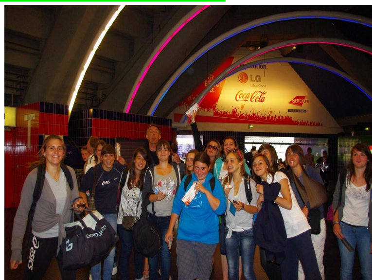
Le CD17 aux Finales des Coupes de France Le 21 mai 2011