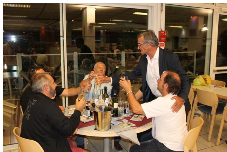
50 ans du Comité 17 Le 16 juin 2018 A Ronce Les Bains