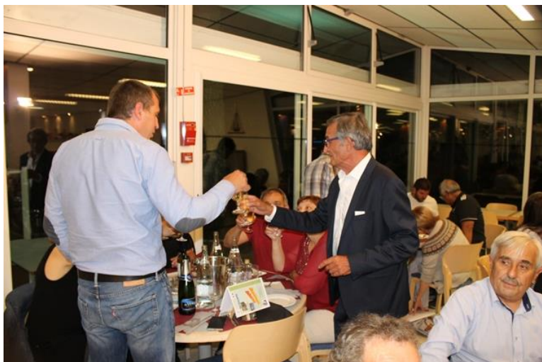
50 ans du Comité 17 Le 16 juin 2018 A Ronce Les Bains