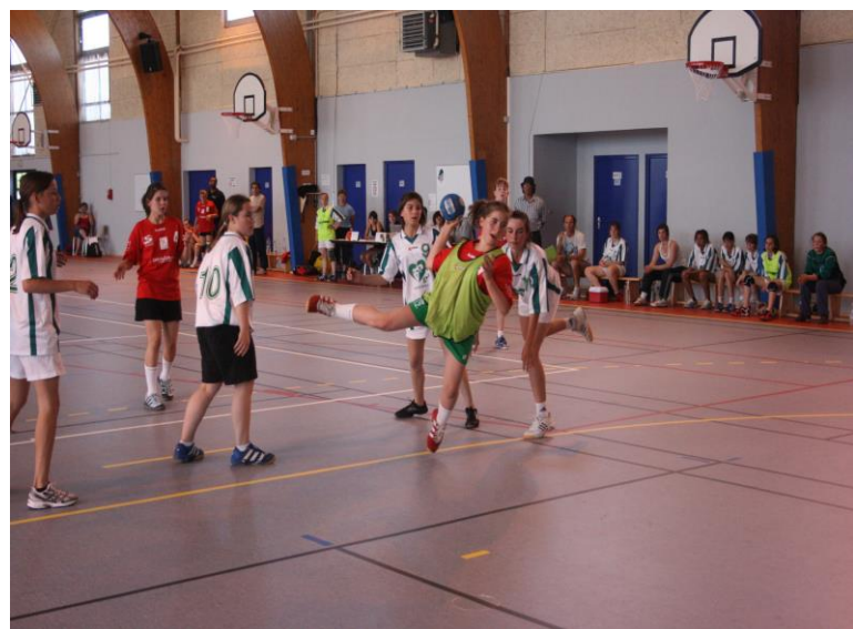
Inter Départementaux Le 30 mai 2009 A ?