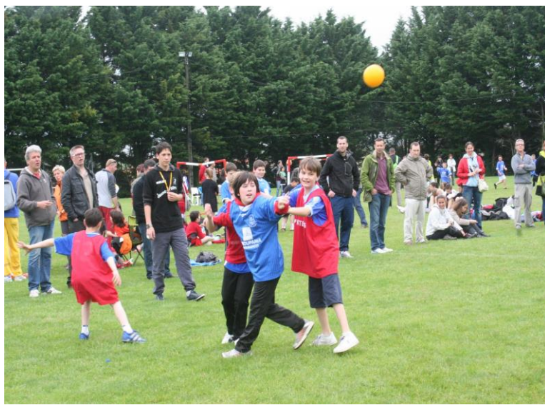
Journée régionale des Jeunes Le 8 mai 2013 A Civray