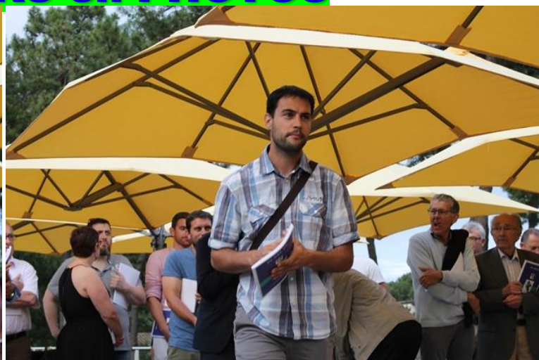
50 ans du Comité 17 Le 16 juin 2018 A Ronce Les Bains