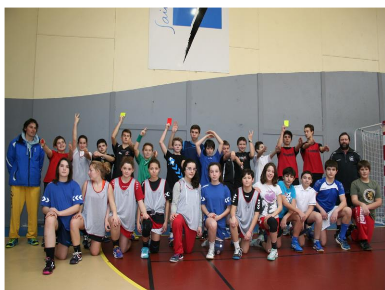
Stage JAJ Le 26 janvier 2014 A St. Jean