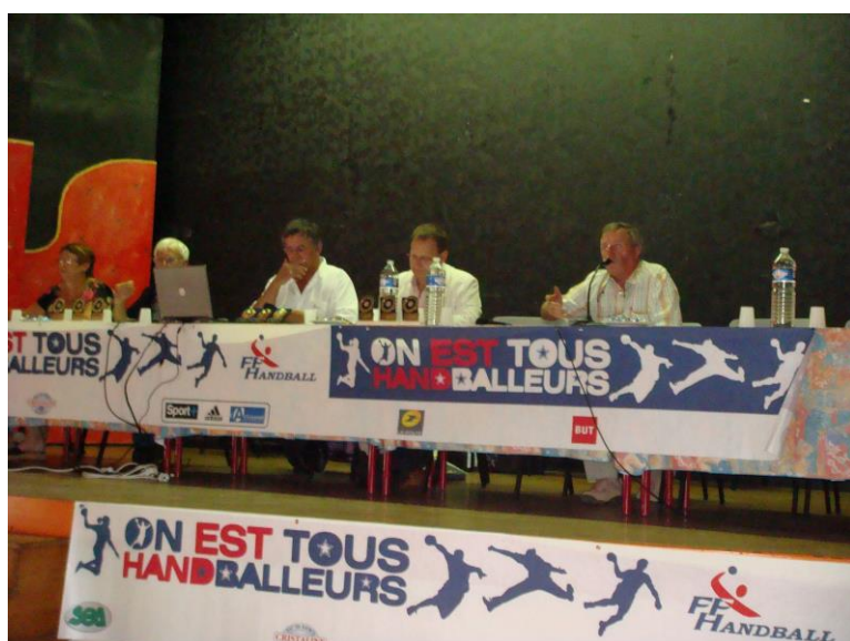
AG du Comité 17 Le 13 juin 2009 A Azuréva Ile d'Oléron