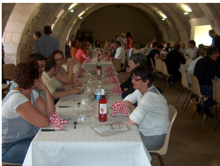
AG du CD 17 Le 12 juin 2010 A Montguyon