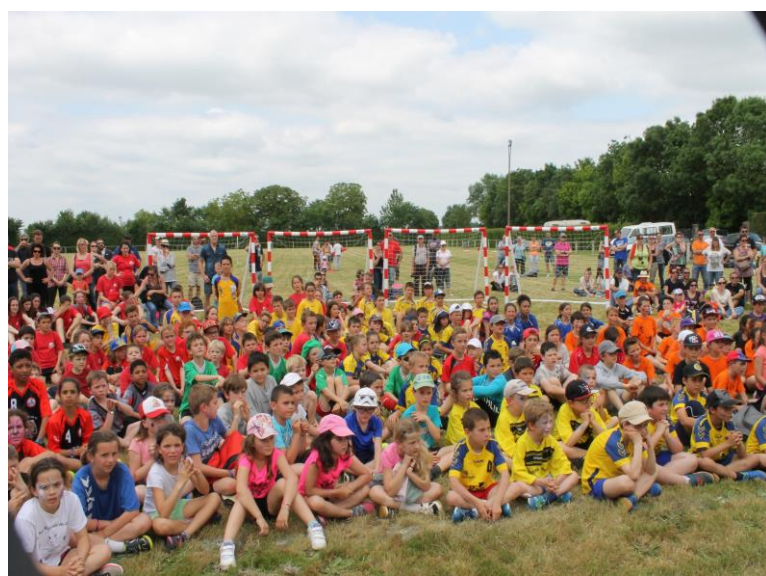
Journée des Jeunes Le 5 juin 2016 A Cram