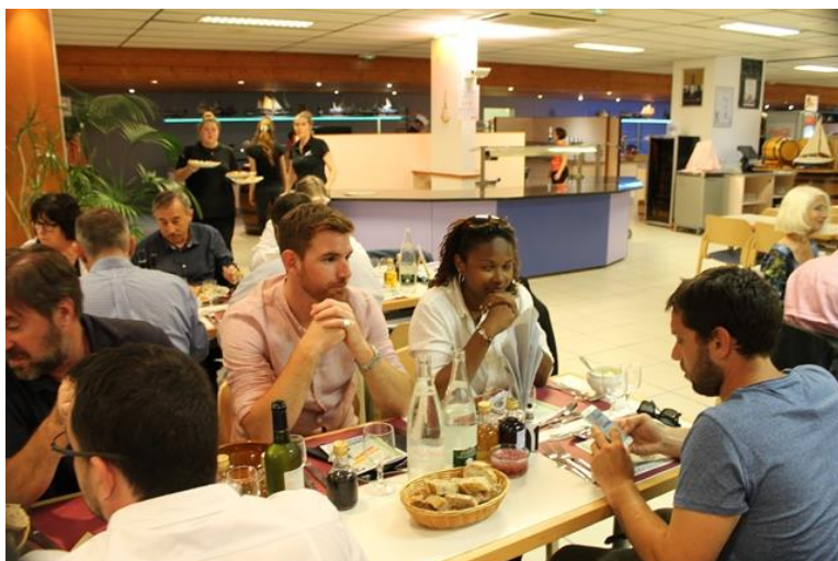
50 ans du Comité 17 Le 16 juin 2018 A Ronce Les Bains