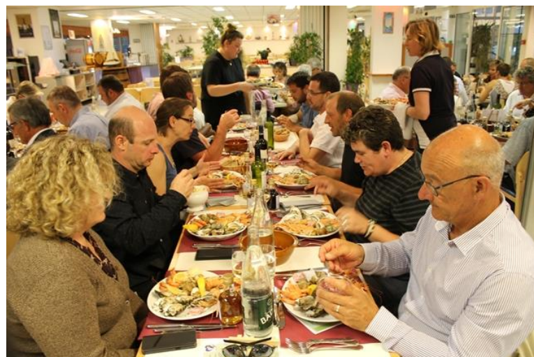
50 ans du Comité 17 Le 16 juin 2018 A Ronce Les Bains