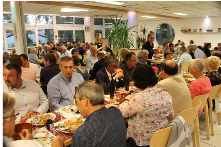
50 ans du Comité 17 Le 16 juin 2018