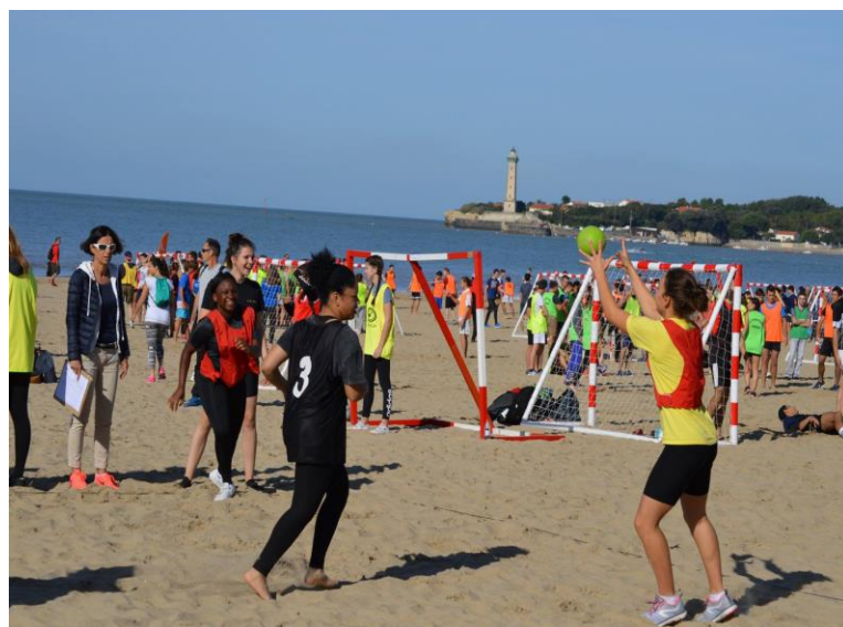
« 100% Beach » Le 27 septembre 2017 A St.Georges