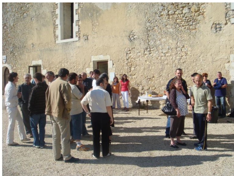
AG du Comité (Pause-café) Le 12 juin 2010 A Montguyon