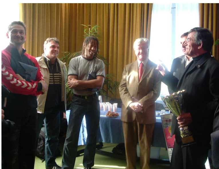
Remise du Label Ecole de Hand Le 15 février 2003 A Royan