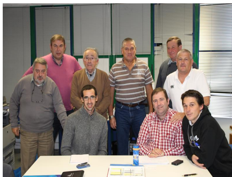
Réunion de la CDA Le 28 octobre 2013 A Saintes