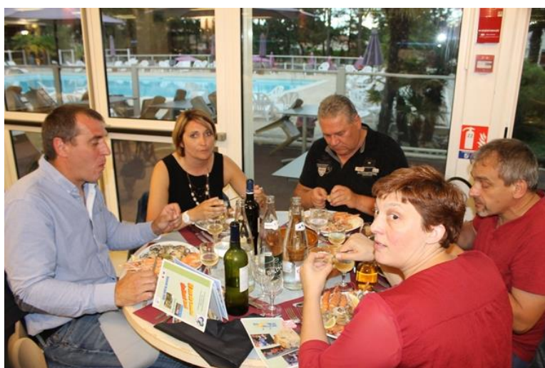
50 ans du Comité 17 Le 16 juin 2018 A Ronce Les Bains