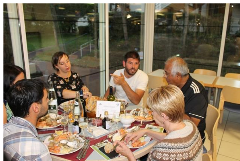
50 ans du Comité 17 Le 16 juin 2018 A Ronce Les Bains